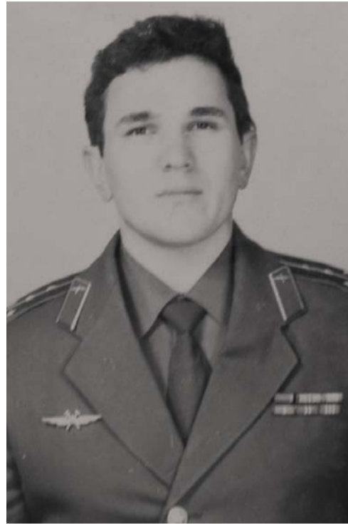
Ильнур Кабышев.

Перед операцией все испытания искусственные помощники прошли успешно: они прекрасно ориентировались в пространстве, могли обходить преграды, «видели» край. Оставалось одно: доставить их на крышу станции. Это было поручено вертолёту Ильнура Кабышева. Кто держал в руках удочку, знает, как не просто