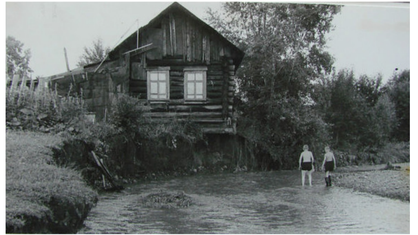
Ловля усачей на Травянке.

- Смотри, ребя, дядя Вася на телеге едет, давайте попросимся, он нас покатает, - сказал Колян,