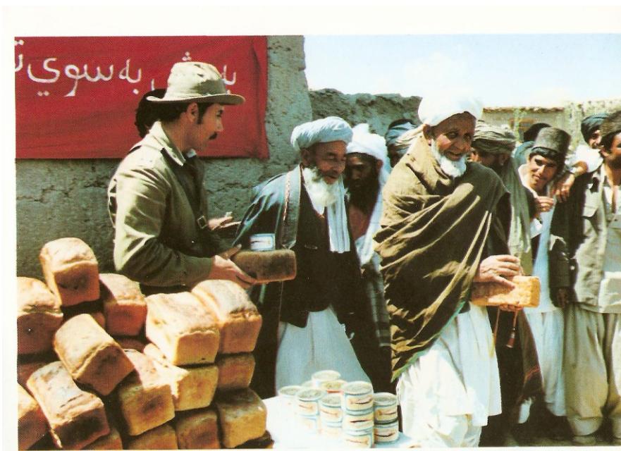
Раздача гуманитарной помощи в афганском кишлаке.

следующем: земляки призывали земляков заканчивать со средневековым образом жизни. А если конкретно, они - с блеском веры и надежды в глазах - говорили о том, как важно уметь читать и писать, что скоро в селениях появятся школы, больницы, что жизнь наладится. Также призывали вступать в Народную демократическую партию Афганистана (НДПА).