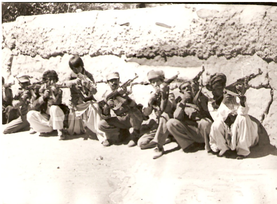
Подразделение ГЗР в Афганистане.

Как только мальчишка-афганец овладевал небольшими навыками владения автоматом, он получал право вступить в ГЗР. Возрастная граница ополченцев не была определена.