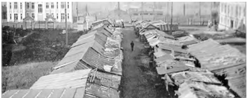
Площадь Революции. 1914 г.

На следующем фото торговые ряды также видны. Снимок сделан из окна дома купца Ярославцева. Слева - здание будущего Проектного отдела ЛМЗ.