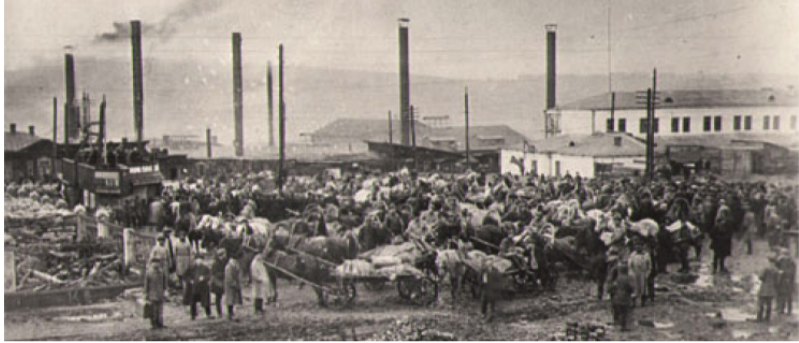
Лысьва, пл. Революции, 1927 год. Фото: Н.Парфёнов «Лысьва и лысьвенцы» ( http://enc.lysva.ru/3/3-2.pdf ).