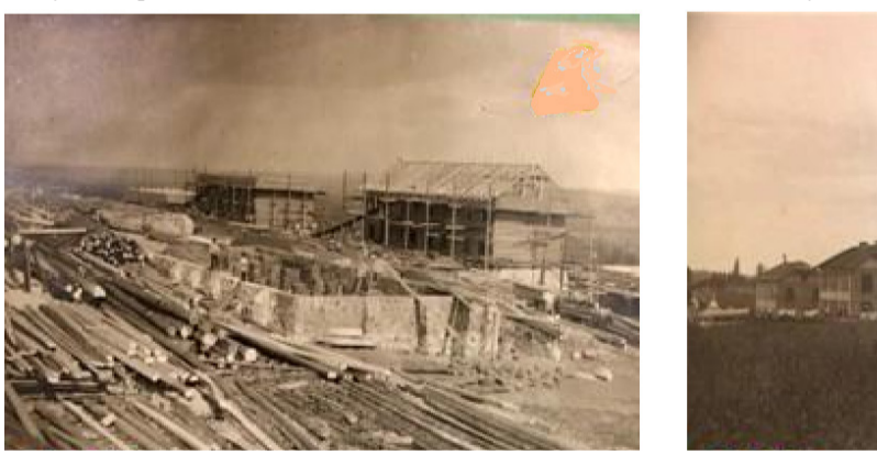
Строительство Госстроя.

ит не шевельнётся, возможно, читает молитву о спасении. «Скорей бы всё это кончилось», - думает он.