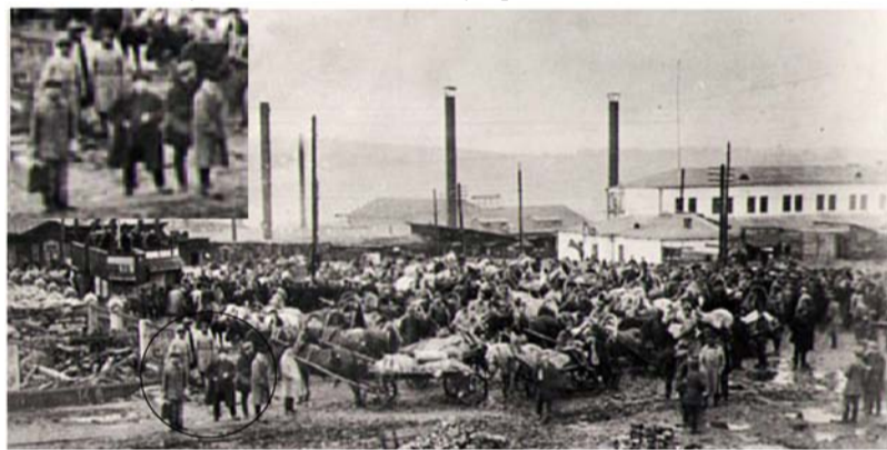
Странная компашка. Фрагмент главной фотографии.

Да Бог с ними, с коммунистами. А вот это что за компания, стоящая отдельно от торгующей толпы? Явно у них сомнительные интересы на этом базаре... Первый слева явно бухгалтер-счетовод. Стоит с чемоданом денег (в те времена деньги были очень дешёвые, потому носили их не в ко-