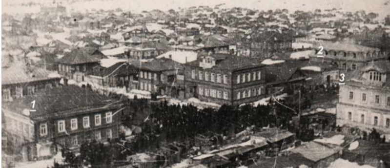
Вид на площадь Революции со Свято-Троицкого храма. 15 марта 1914 г.

Да нет, конечно! Что вы, наша площадь и раньше не пустовала, но она была организованно-торговой, можно сказать, купеческой. На ниже представленной фотографии это прекрасно видно.