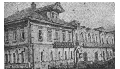
Дом купца Ярославцева.

Тяжёлый случай. «Лысьва потеряла памятник купеческого комплекса с жилыми помещениями, флигелем, магазином, складами, въездными воротами и т.п.» - Н.Парфёнов (прим. автора).