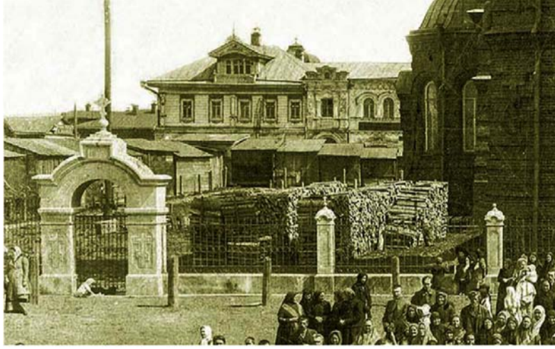
Дровяной склад при храме до революции.

Итак, насчёт трибуны. У коммунистов юбилей! Как-никак 10 лет Советской власти, и без трибуны тут не обойтись. Коммунистов на фото вы сразу найдёте, они собрались перед трибуной чёрной кучкой на светлом