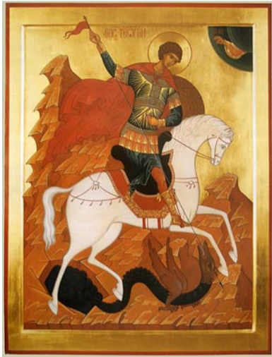
Лысьва, Свято-Троицкий храм. Икона Св. Георгия.

Прежде всего к нему обращаются воины как к святому, который