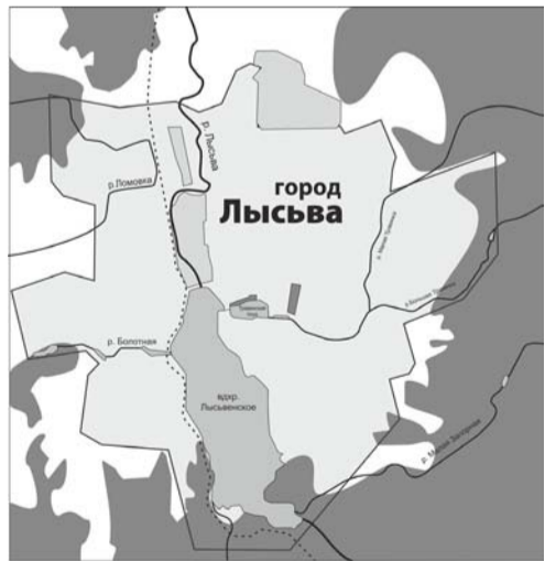
Лысьва сегодня. Монтаж Дарьи Вьюговой