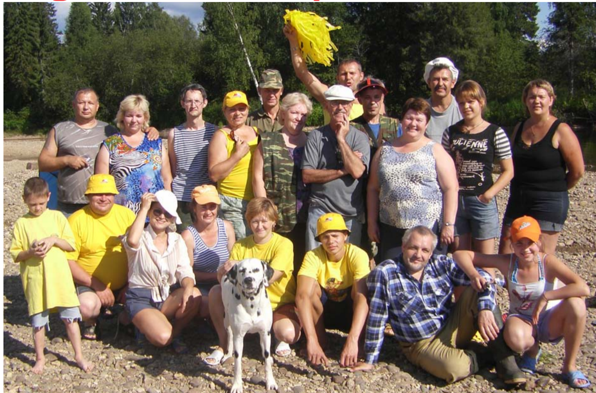
Наша дружная команда.

Сначала дети были маленькими, потом выросли, многие закончили