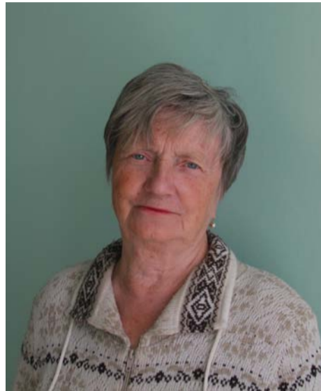
Е.М. Винокурова.